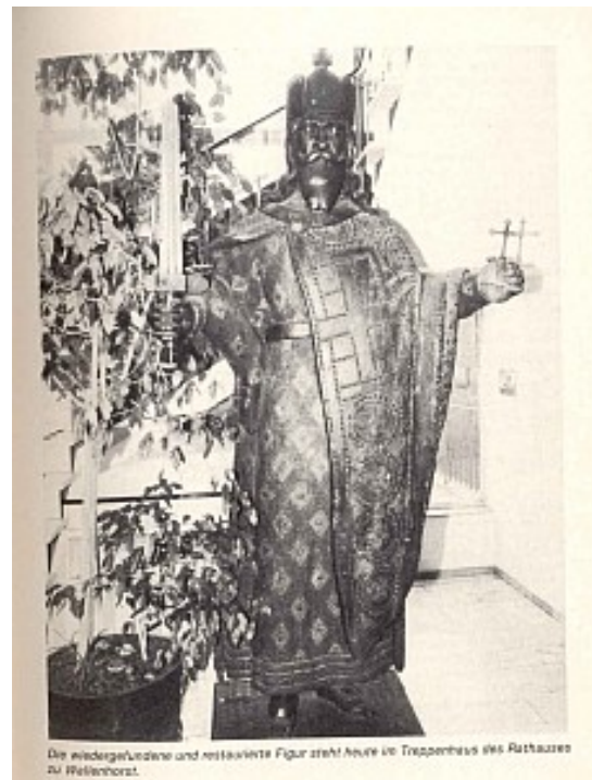
Die wiedergefundene und restaurierte Figur steht heute im Treppenhaus des Rathauses zu Wellenhorst.