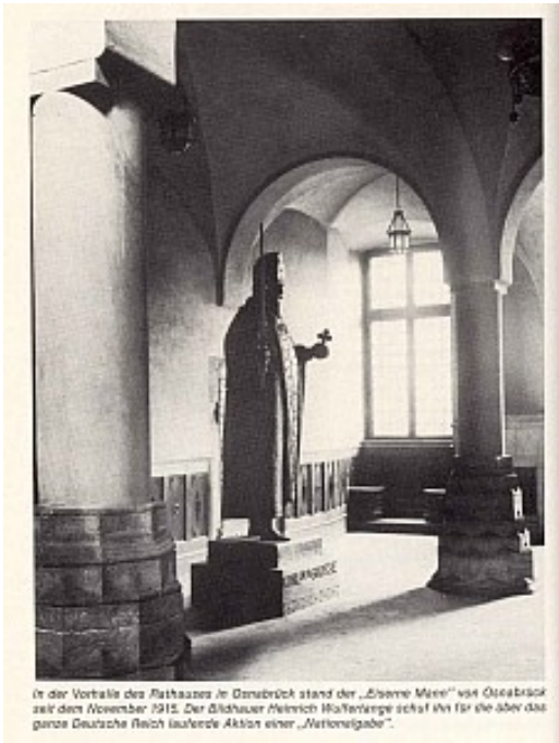
In der Vorkammer des Rathauses in Osnabrück stand der „Ewige Meier“ von Osnabrück seit dem November 1915. Der Bildhauer Heinrich Hoffmeister schuf ihn für die über das ganze Deutsche Reich laufende Aktion einer „Nationalgabe“.