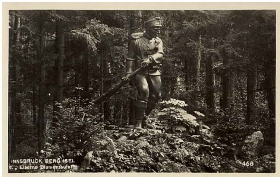
INNSBRUCK/Österreich: Soldat (Eiserner Blumentempel), geschaffen aus Zirbelholz vom Bildhauer Johann Heinrich nach einem Entwurf von Albin Egger-Lienz, aufgestellt in der Maria-Theresien-Straße, heute im Tiroler Kaiserjäger-Museum auf dem Berg Isel. BILD