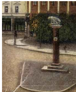
INGOLSTADT: Löwe auf einer Säule, Benagelung zugunsten des Roten Kreuzes BILD